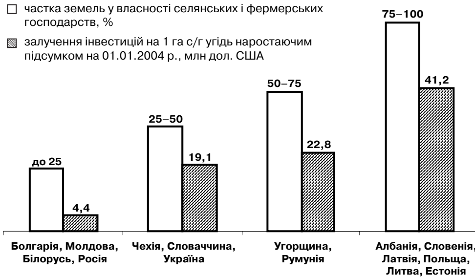
Рис. 1. Іноземні інвестиції та приватне землекористування в сільському господарстві окремих країн Центральної і Східної Європи

Джерело: Никитченко И.И. Опыт земельной реформы и агропромышленного комплекса постсоциалистических стран // Сб. докладов и законопроектов. – Минск, 2002. – С. 14; Осташко Т.О. Аграрні трансформації в перехідних економіках: перспективи для України // Економіка і прогнозування. – 2003. – № 1. – С. 64; www.fao.org ; www.unctad.org/templates/page.asp?intItemID=31988&lang=1 .