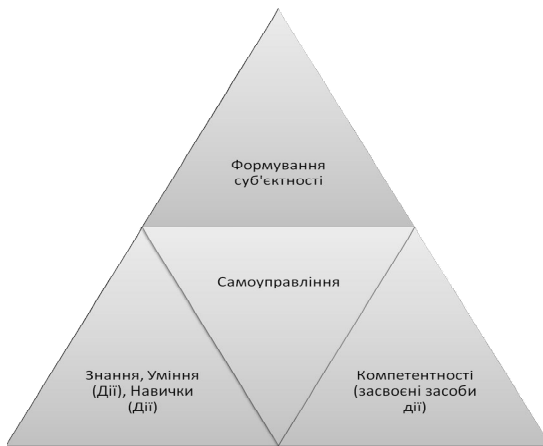
Рис. 3. Модель формування суб’єктності в освітньому середовищі

Якщо викладання суспільствознавчих дисциплін може забезпечити поінформованість учнів щодо основ демократичного устрою, громадянської та політичної участі, то саме творче виховне середовище, налагоджена система самоуправління сприяють засвоєнню відповідних способів діяльності (компетентностей) і, урешті-решт, формуванню суб’єктності учня (рис 3).