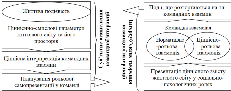
Рис. 2. Суб'єктне осмислення/інтерсуб'єктне творення командних взаємин

Близькими до такого базис-презентаційного розуміння людини в її ціннісно-рольовій сутності є ідеї О. Г. Асмолова про “план змісту” (сміслові утворення, мотиви, життєві цілі, загальна спрямованість) і “план вираження” (прояв особистості в діяльності) особистості [1]; Б. С. Братуся – про “особистісно-смісловий” (загальний зміст життя, ставлення до себе, інших) та “індивідуально-виконавчий” (реалізація смислових орієнтацій у конкретній діяльності) рівні структури особистості [3]; Д. О. Леонтьєва про “смісловий” (внутрішній світ) та “експресивно-інструментальний” (зовнішні способи взаємодії зі світом) рівні структурної організації особистості [12]. При цьому Леонтьєв прямо вказує, що як структури другого рівня він розглядає “... поряд із рисами характеру і здібностями також ролі, включені людиною у свій репертуар” [там само, с. 159]).