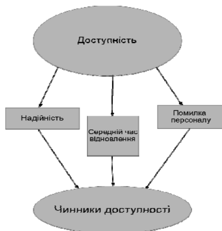
Рис. 1. Критерій доступності

На рис. 1 представлені елементи що входять в критерій доступності.