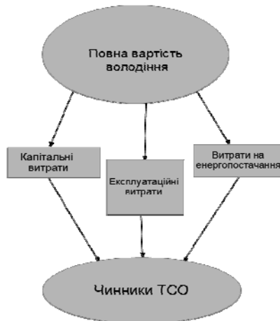
Рис. 3. Критерій повної вартості володіння

Терміном «повна вартість володіння» або «ТСО» виражаються витрачені кошти (рис. 3).