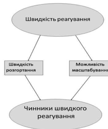
Рис. 2. Критерій швидкості реагування

• забезпечити, щоб система приймала і легко обробляла постійні зміни, не сприяючи виникненню помилок з боку людського чинника.