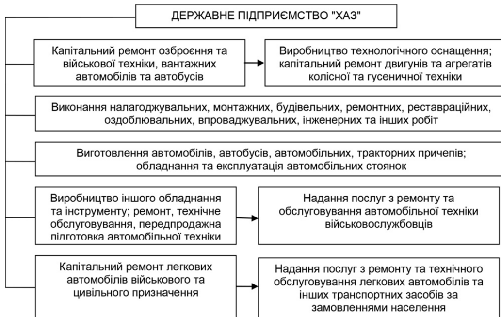
Рис. 1. Основні напрями діяльності ДП "ХАЗ"

Замовниками заводу, крім Міністерства оборони України, є державний концерн "Укрспецекспорт", підприємства та організації м. Харкова і Харківської області, Сумської, Полтавської, Донецької, Дніпропетровської, Луганської областей, м. Києва, м. Кременчук, м. Івано-Франківськ, м. Черкаси, Запорізької області, Азербайджану, Польщі, Міністерство оборони Індії та ін.