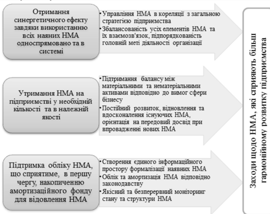
Рис. 3. Вихідні положення при впровадженні НМА на підприємство. Розроблено авторами

Подолання названих вище проблем можливо при використанні сучасного методичного забезпечення та інформаційної бази, спираючись на основні положення при впровадженні та використанні НМА на підприємстві (рис. 3), що сприятимуть більш гармонійному його розвитку.