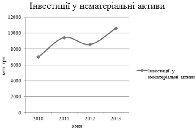
Рис. 1. Інвестиції у нематеріальні активи. Розроблено авторами за даними [9]

На українських підприємствах такої оцінки не проводилося, але зробити висновки про стан нематеріальні активи можна на підставі даних про їх фінансування. Не зважаючи на те, що інвестиції у нематеріальні активи мають слабку позитивну динаміку, їх частка у загальній кількості активів не перевищує 4%. (рис.1 та рис. 2). Можна припустити, що і частка нематеріальних активів у загальній величині необоротних активів підприємств складає приблизно 4%, що майже в 7 разів нижче, ніж у провідних зарубіжних компаній. Таке положення справ є одним з факторів низької конкурентоспроможності українських підприємств на світовому ринку.