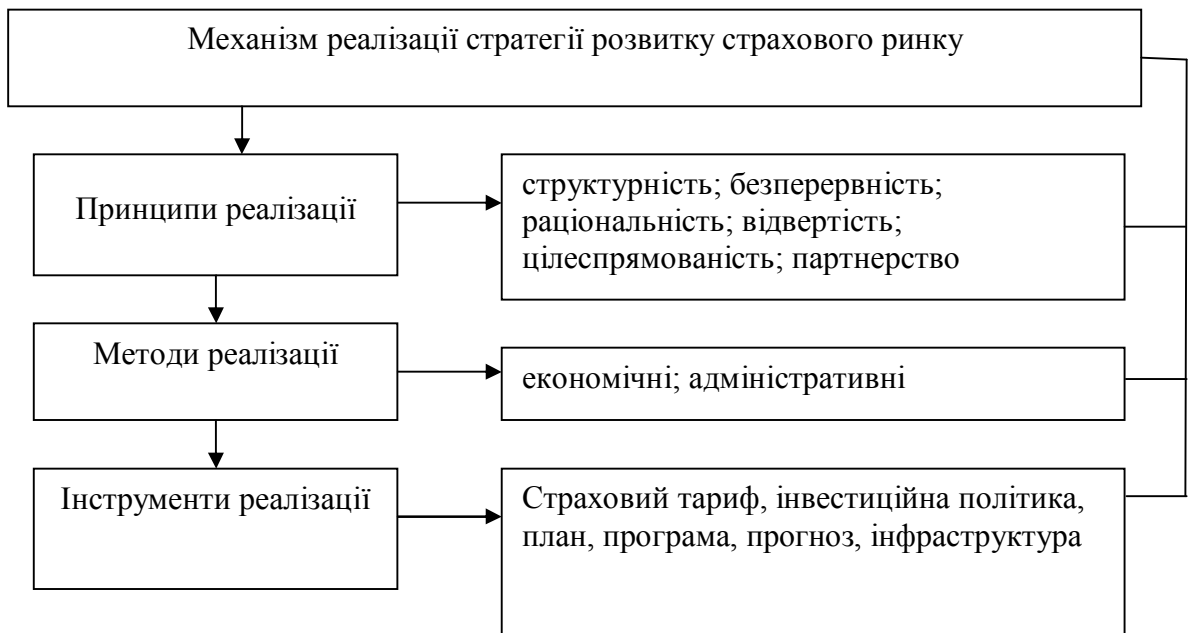
Рис. 3. Механізм реалізації стратегії розвитку страхового ринку

Механізм реалізації стратегії розвитку (рис. 3) можна визначити як сукупність принципів, форм, методів і інструментів, що впливають на страховий ринок.