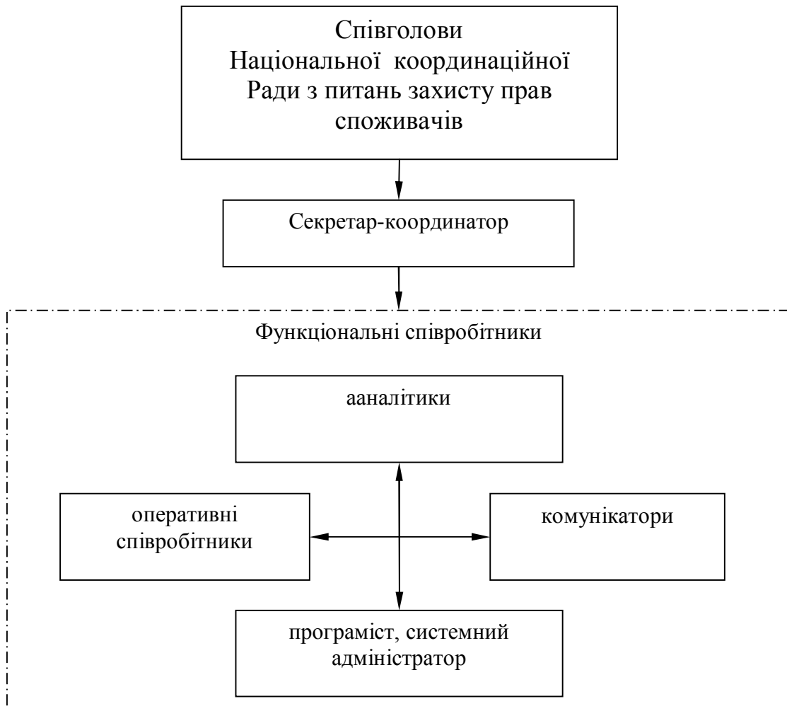
Рис. 2. Організаційний аспект механізму державного регулювання споживчих ринків: функції Національної координаційної ради

Секретар Ради є координатором діяльності функціональних співробітників, інформуючи їх про необхідність підготовки інформаційних і аналітичних звітів для чергового (чи позапланового) засідання його членів. Додаткова структура Ради є функціональною з мінімумом лінійних повноважень, тому що кожна з груп співробітників орієнтована на виконання заданих функцій і взаємодію із зовнішнім середовищем: споживачами, органами державної влади і місцевого самоврядування.