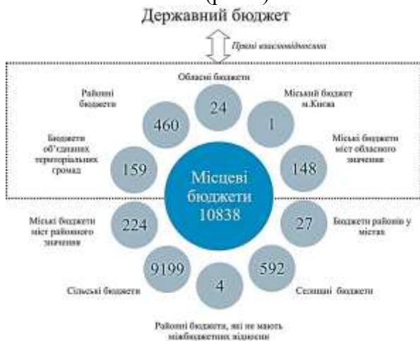
Рис. 1. Структура місцевих бюджетів у 2016 році

Місцеві бюджети мають свою внутрішню структуру та характерні відмінності. Усі місцеві бюджети є самостійними, що забезпечується закріпленням за ними відповідних джерел доходів бюджету, правом місцевих органів влади визначати напрями використання бюджетних коштів відповідно до законодавства України, правом відповідних місцевих рад самостійно і незалежно розглядати та затверджувати відповідні місцеві бюджети. На сьогодні налічується 10838 місцевих бюджетів, найчисельнішу групу становлять сільські й селищні бюджети - 9792, обласні бюджети – 24, бюджети міст обласного підпорядкування – 148, бюджети міст районного значення – 224 (рис. 1).