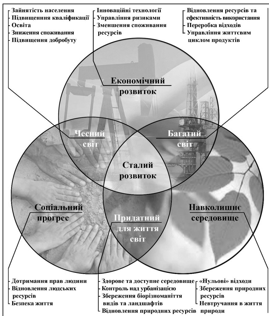
Рис. 1. Концепція сталого розвитку 1992 року.

на довкілля. Тож запропоновані рішення було спрямовано в першу чергу на приведення до відповідності наявного стилю господарської діяльності та екологічної ємності екосистеми планети. І хоча документ носив більш декларативний, ніж практичний характер, було важливо, що він сформував подальший напрям для вироблення та впровадження ідей сталого розвитку на глобальному рівні.