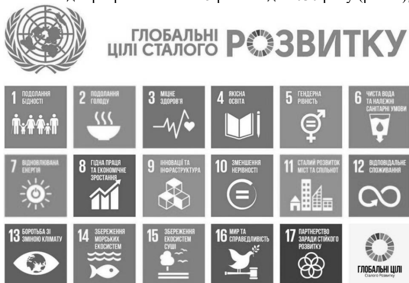
Рис. 2. Глобальні цілі сталого розвитку, прийняті ООН у 2015 році.

Важливо, що враховуючи досвід роботи над Декларацією тисячоліття, було прийнято рішення про те, що діяльність із реалізації цілей і завдань сталого розвитку і їх огляд має проводитись з використанням набору певних глобальних показників, які будуть доповнюватися показниками на регіональному та національному рівнях, що мають бути розробленими державами-членами ООН. Було треба, щоб сформована система була простою, надійною, охоплювала всі цілі і завдання, включаючи засоби їх здійснення. Були сформульовані та затверджені 17 цілей нового плану дій, які набули чинності 1 січня 2016 року, а робота над цим планом дій розрахована на 15 років – до 2030 року (рис. 2), [14].