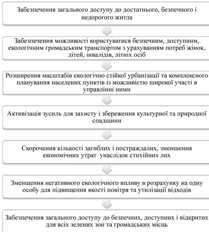
Рис. 3. Завдання щодо забезпечення сталого розвитку міст та спільнот у декларації ООН «Sustainable Development Goals»

В Україні ці, прийняті на міжнародному рівні документи також були взяті до уваги, впродовж 2017-2019 років було розроблено Національну доповідь «Цілі сталого розвитку: Україна» від Міністерства економічного розвитку і торгівлі України, яка не мала законодавчої сили, а також запропоновано декілька проєктів закону про стратегію сталого розвитку України до 2030 року, які на жаль не були прийняті [15, 16]. Серед законодавчих актів було прийнято лише Державну стратегію регіонального розвитку до 2020 року (в редакціях 2014, 2017, 2019 та 2020 року) та Указ Президента «Про Цілі сталого розвитку України на період до 2030 року» (2019 р.), які наразі мали декларативний та рекомендаційний характер [17, 2]. Тож на жаль, сьогодні ми не маємо чинної державної програми сталого розвитку з певними завданнями та термінами виконання, лише якісь окремі заходи ми можемо спостерігати на місцевому рівні у програмах окремих міст та регіонів.