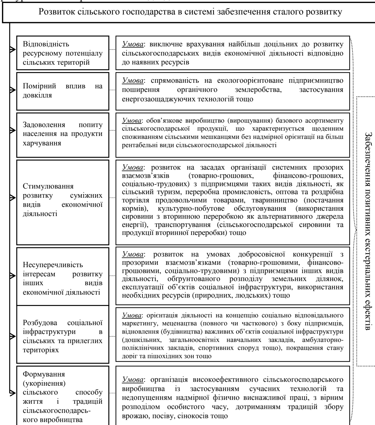
Рис. 1. Наукове обґрунтування пріоритетності сільського господарства у контексті забезпечення сталого розвитку сільських територій*

розвитку саме даного виду економічної діяльності, щодо якого сформовані століттями традиції та спосіб життя на селі. Здобуття таких переваг (рис. 1) надає всі підстави стверджувати про формування сприятливих передумов життєдіяльності наступних поколінь, що є важливою вимогою забезпечення сталого розвитку. Такі сприятливі передумови будуть проявлятися не лише у можливості проживати в середовищі без помітних деструктивних впливів антропогенного характеру, які є наявними через активний розвиток, для прикладу, ресурсомістких промислових видів діяльності.