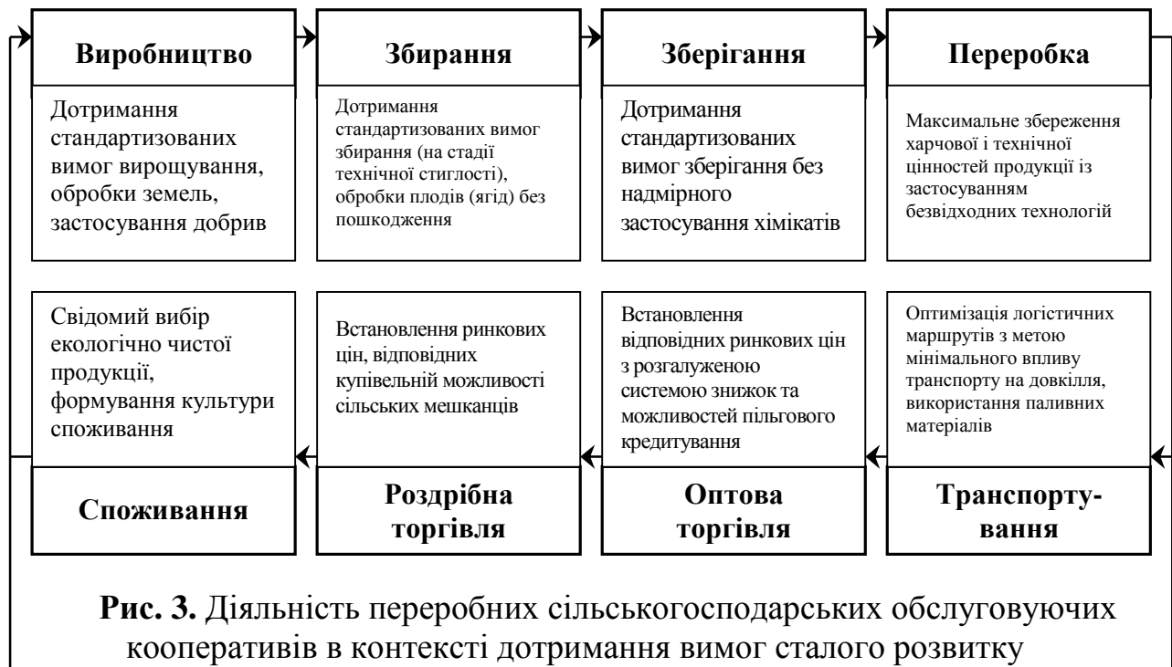
Рис. 3. Діяльність переробних сільськогосподарських обслуговуючих кооперативів в контексті дотримання вимог сталого розвитку сільських територій*

Контроль за дотриманням таких вимог повинен здійснюватись через важелі впливу організаційно-економічного механізму забезпечення сталого розвитку сільських територій, зокрема із застосуванням як прямих форм контролю, так і опосередкованих впливів шляхом формування сприятливого бізнес-середовища сільськогосподарської діяльності із застосуванням економічного регуляторного інструментарію (бюджетного фінансування, інвестиційного, податкового, фінансово-кредитного, цінового регулювання, державних замовлень і закупівель тощо).