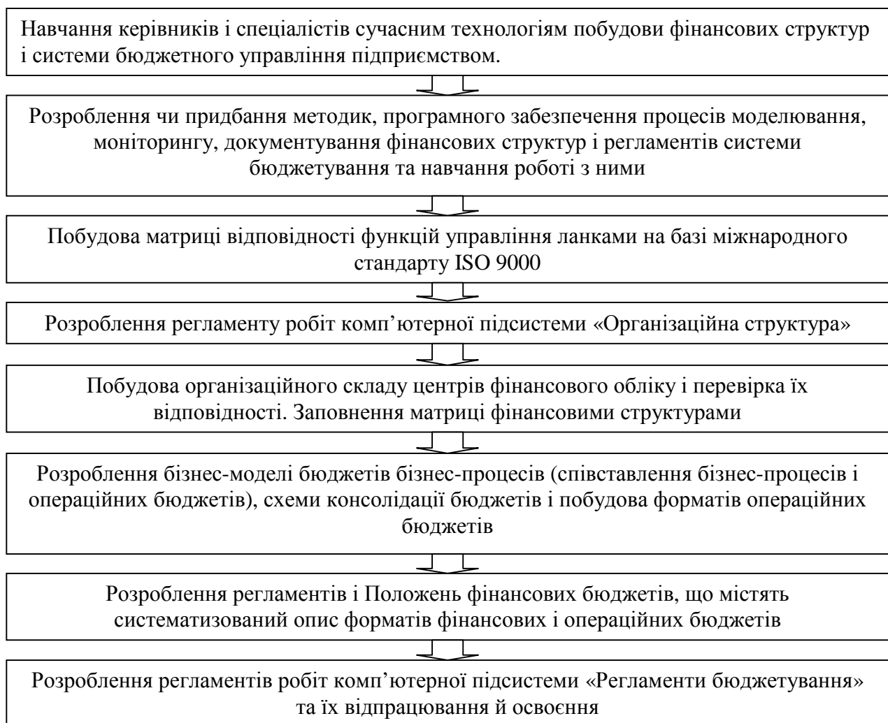
Рис. 2. Схема сучасної технології постановки бюджетування [12, с. 400].

Проте найскладнішою є проблема поєднання і узгодження усіх функцій управління, які тепер виконуються різними функціональними управлінськими підрозділами і слабо координуються. Адже це потребує часткової перебудови існуючої ОСУП (організаційна система управління підприємством), зміни в певній мірі функціональних обов'язків працівників, а це складно.