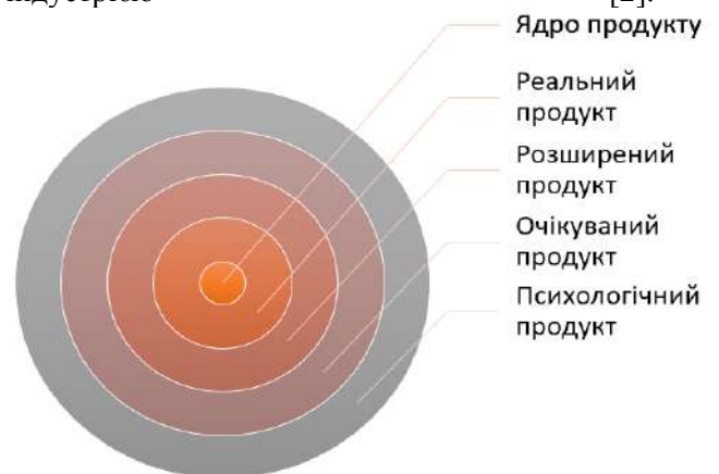
Рис. 1. Структура туристичного продукту

Виклад основного матеріалу. Туристичний продукт - комплекс туристичних послуг (рис.1), які забезпечують прийом та обслуговування туристів (готелі, туристичні комплекси, підприємства харчування, транспорт, установи культури, розваг, спорту, рекреації та ін.). Сукупність таких структур є туристичною індустрією [2].