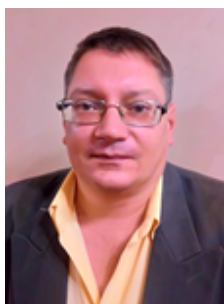
Краснобрижий І.В. © кандидат юридичних наук