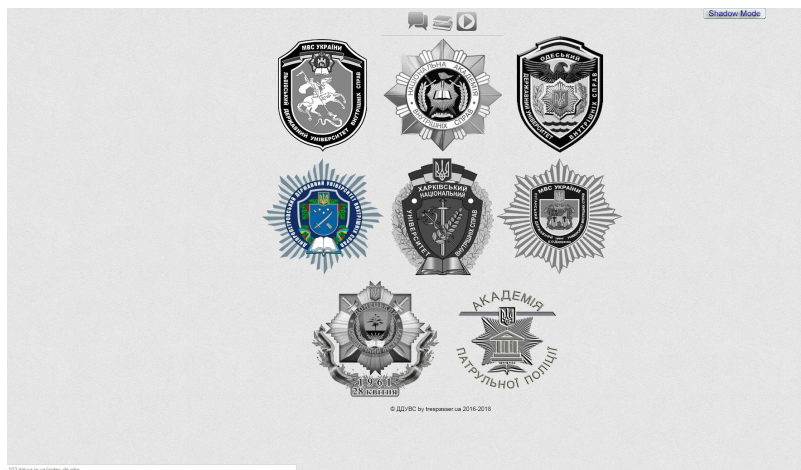
Рис. 1. Загальний вигляд веб-ресурсу «Лінія 102»

Найбільш яскравим прикладом реалізації поліцейського квесту є навчальна інформаційно-технічна платформа комплексних оперативно-тактичних навчань «ЛІНІЯ 102» [3, с. 156–201]. Дана ділова гра являє собою комплексні оперативно-тактичні навчання. Вона запроваджена як різновид навчальної або позанавчальної роботи з курсантами та студентами випускних курсів. Інформаційно-технічна платформа впроваджена в усіх навчальних закладах системи Міністерства внутрішніх справ. Вона розміщена на хостингу та підтримується фахівцями Дніпропетровського державного університету внутрішніх справ. Веб-вузол 102.dduvs.in.ua має вигляд (рис. 1):