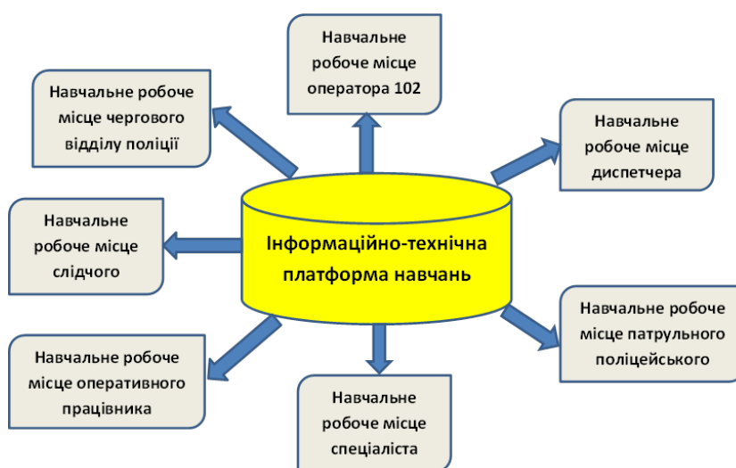
Рис. 2. Загальний вигляд інформаційно-технічної платформи «Лінія 102»

Інформаційно-технічна платформа складається з таких навчальних місць (рис. 2):