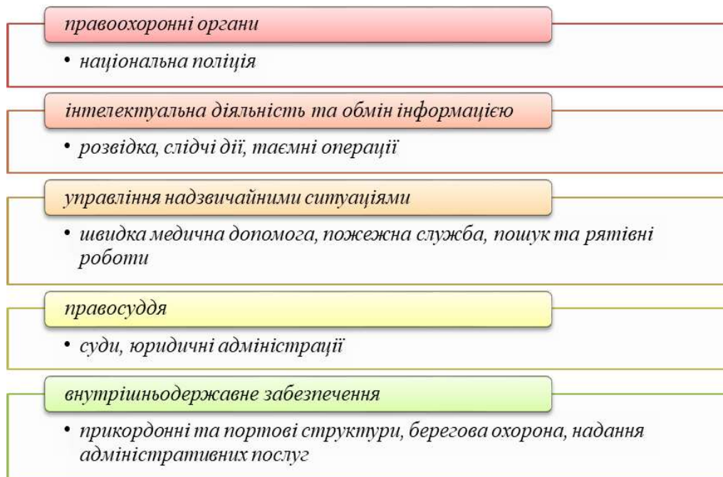
Рис. 1. Графічне зображення умов забезпечення громадської безпеки

Таким чином, громадська безпека – це стан упорядкованих суспільних правовідносин, при якому кожна особа, державний орган, органи місцевого самоврядування та їх посадові особи з власної волі дотримуються правових і морально-етичних норм, соціальних норм і правил, виконують усі рекомендації з метою досягнення громадської безпеки та благополуччя.