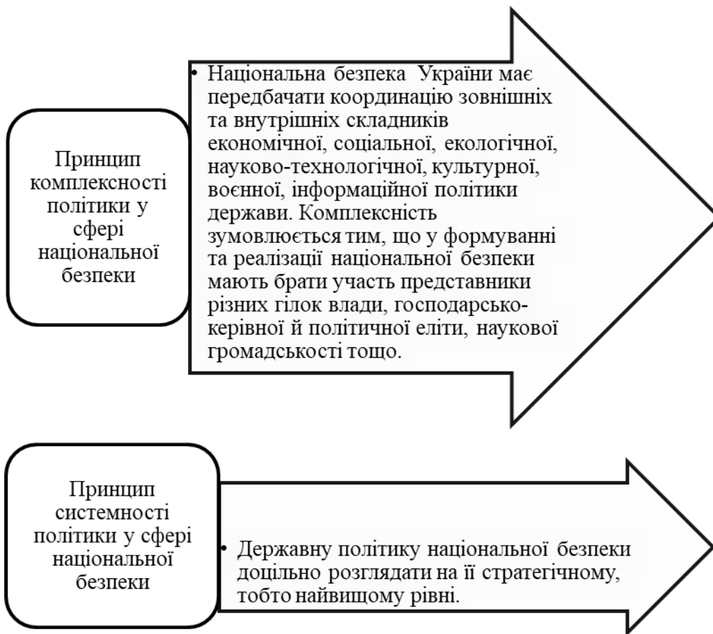
Рис. 3. Базові принципи побудови політико-правових методів впливу на національну безпеку держави