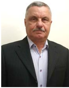
Олег ЛЕВІН © кандидат історичних наук, доцент (Дніпропетровський державний університет внутрішніх справ, м. Дніпро, Україна)