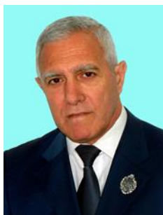
Аріф ГУЛІЄВ © доктор юридичних наук, професор, Заслужений працівник освіти України (Київський університет інтелектуальної власності та права Національного університету «Одеська юридична академія, м. Київ, Україна)