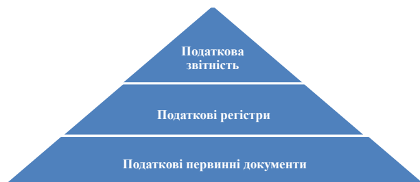
Рис. 1. Структура системи обліку бази оподаткування підприємств

Система обліку бази оподаткування підприємств має трирівневу структуру (рис. 1):