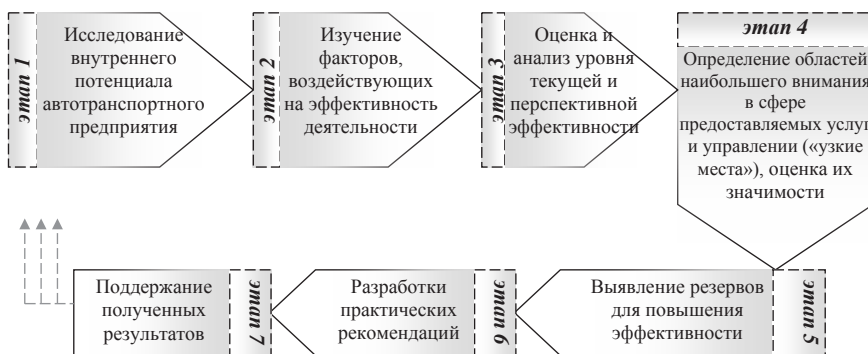
Рис. 1. Этапы управленческих действий для повышения эффективности автотранспортных предприятий (разработано авторами)

Не следует забывать, что на работу автотранспортных предприятий также оказывают влияние факторы, присущие данной сфере деятельности. Предлагается для исследования их разделять на три группы: факторы ма-