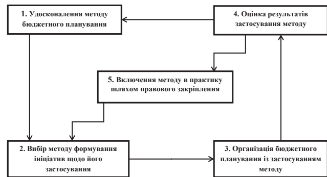
Рис. 2. Принцип модифікації методології бюджетного планування [5, с. 114]

Усі вищезгадані фактори можуть залишитися такими без змін у разі, якщо методологічні підходи до підвищення ефективності бюджетних витрат і всієї системи управління державними фінансами залишаться на тому ж рівні. Головним фактором ефективності виступає модифікація методології бюджетного планування. Можливим є також процес модифікації методології бюджетного планування, який потрібно розкласти на послідовні етапи і тільки після апробації та доопрацювання відповідно до реальних умов країни впроваджувати повномасштабно із закріпленням у нормативних правових актах країни. Даний принцип можна відобразити графічно (рис. 2).