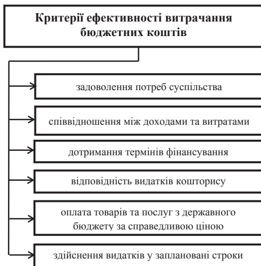
Рис. 4. Критерії ефективності витрачання бюджетних коштів [9, с. 78]

Бюджетне планування є складовою загальнодержавного економічного планування і займає центральне місце у фінансовому плануванні, тобто є невід'ємною частиною фінансового механізму держави. Відтак, від рівня збалансованості бюджету на стадії планування, точності прогнозів показників соціально-економічного розвитку залежать рівень виконання бюджетних програм протягом майбутнього бюджетного періоду, рівень ефективності управління бюджетними коштами та стабільність функціонування бюджетної сфери загалом.