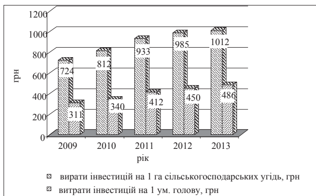
Рис. 3. Витрати на 1 га сільськогосподарських угідь та 1 ум. голову в аграрних підприємствах Житомирської області

Сума інвестицій з розрахунку на 1 га сільськогосподарських угідь у 2013 р., порівняно з 2009 р., зростає на 288 грн, або на 40%. Втім, на 1 ум. голову сума інвестицій удвічі менша, що вказує на гальмування розвитку галузі тваринництва (рис. 3).