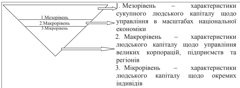
Рис. 1. Рівні управління людським капіталом

Аналіз рис. 2 наглядно демонструє кризову ситуацію щодо зменшення кількості майбутніх абітурієнтів, яка пов'язана виключно з демографічною ситуацією в Україні. Починаючи з 1991 р. народжуваність скоротилася майже вдвічі (від 657 тис. дітей 1990 р. до 377 тис. у 2001 р.). Оскільки у 2008 р. закінчили школу ті, хто народилися у 1991 р., то починаючи від цього року у вітчизняних ВНЗ почали