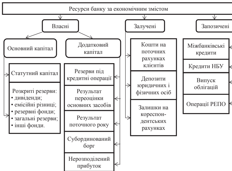
Рис. 1. Класифікація джерел утворення ресурсної бази банків

Головне завдання внутрішньобанківського управління ресурсною базою полягає в тому, щоб мобілізувати тимчасово вільні грошові кошти і перетворити їх в реальні кредитні ресурси. Проте в умовах економічної нестабільності важко ефективно здійснювати стратегічне управління діяльністю банку загалом та