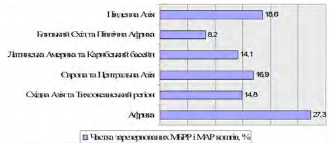
Рис. 2. Частка зарезервованих МБРР і МАР коштів за регіонами (2015 р.), %

У рамках нової моделі операційної діяльності Світового банку, уведеної в дію у 2014 р., групи країн є основною ланкою взаємодії банку з клієнтами й несуть відповідальність за розроблення регіональних стратегій.