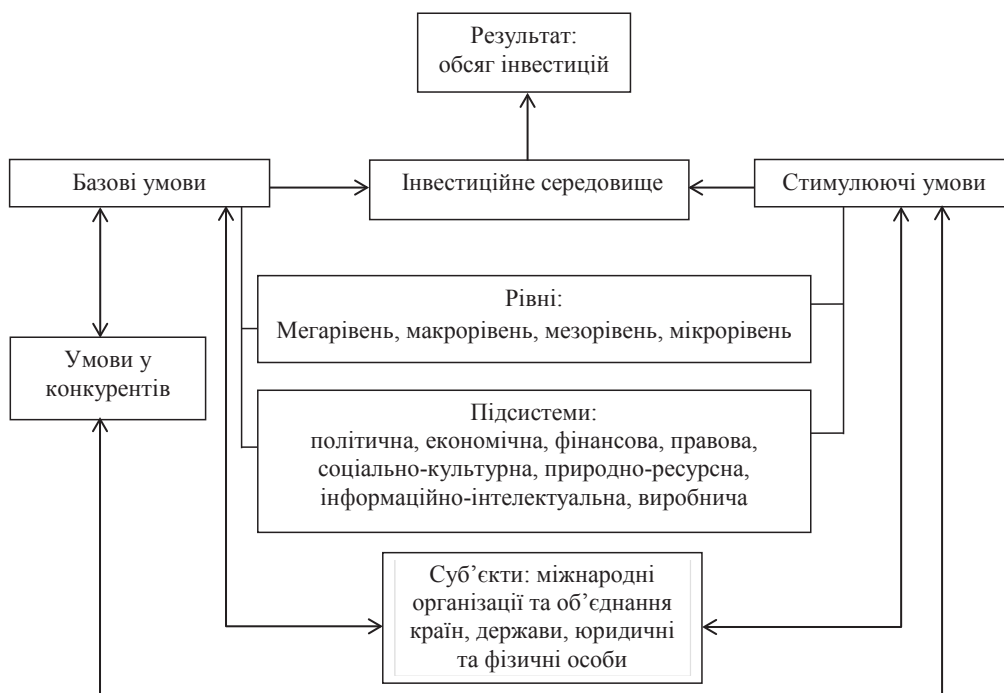
Рис. 1. Система стимулювання інвестиційної діяльності

Третяк Н. М. зазначає, що «До основних факторів, що формують інвестиційний клімат держави