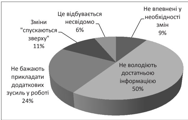
Рис. 2. Причини опору змінам на підприємствах

Інформація про причини опору змінам в організації є важливим джерелом для формування заходів HR-менеджменту, відповідних концепцій і моделей, спрямованих на подолання негативних наслідків опору.