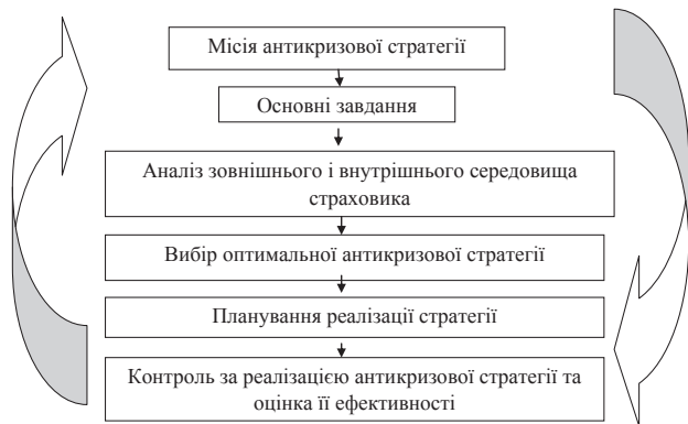
Рис. 2. Основні фактори, що призводять до появи кризи у страховика

бів досягнення визначеної мети, який формується на основі власних інтересів і в межах власної політики [6]. У межах управління страховою компанією антикризова стратегія є інструментом для мінімізації або повного усунення ризиків, пов'язаних із невизначеністю зовнішнього середовища, попередження та подолання кризи та забезпечення постійного прибутку.