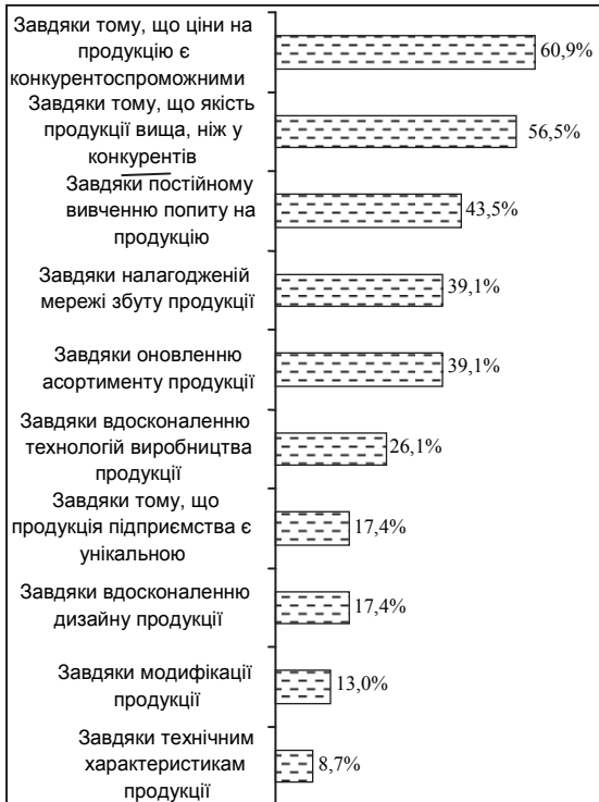
Рис. 3. Конкурентні переваги підприємств молочної галузі на зовнішніх ринках

Збереження конкурентних позицій на зовнішніх ринках можливе за рахунок конкурентоспроможних цін (6,9%) та високої якості продукції (56,5%). Для забезпечення конкурентоспроможності в зовнішньому ринковому середовищі вивчають попит на продукцію, налагоджують мережу збуту продукції та постійно оновлюють асортимент (рис. 3).