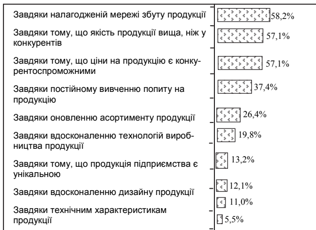
Рис. 2. Конкурентні переваги підприємств молочної галузі на внутрішньому ринку

Враховуючи високий у цілому рівень конкуренції, підприємства намагаються утримувати свої позиції на внутрішньому ринку головним чином за рахунок налагодженої мережі збуту продукції (58,2%), якості продукції (57,1%) та конкурентоспроможних цін (57,1%) (рис. 2).