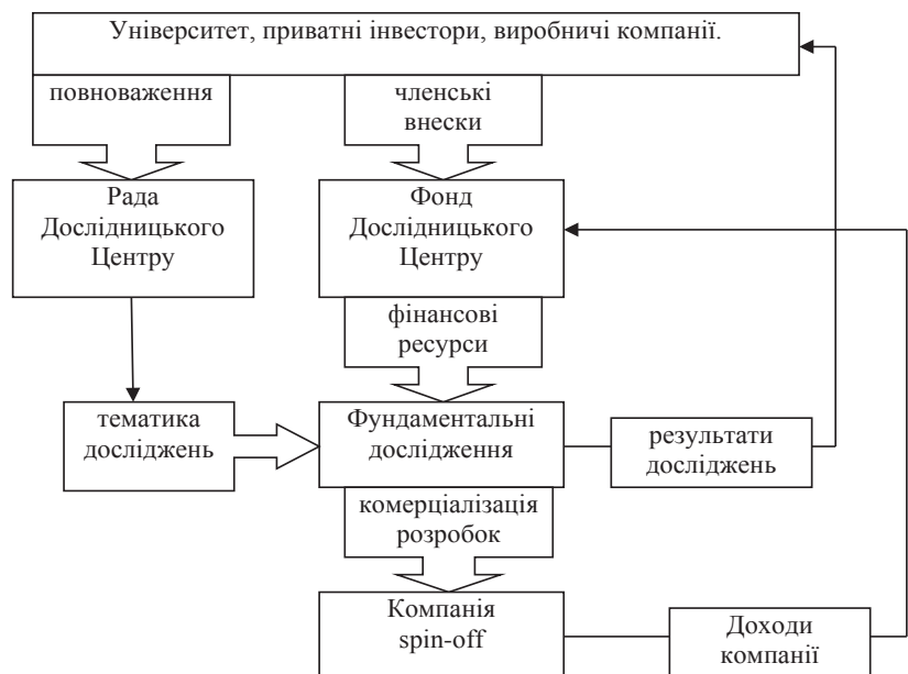
Рис. 2. Базова схема механізму функціонування Дослідницького центру «Університет – промисловість» у формі корпорації

Другий варіант передбачає участь у фінансуванні інноваційної небанківської фінансово-кредитної установи «Фонд