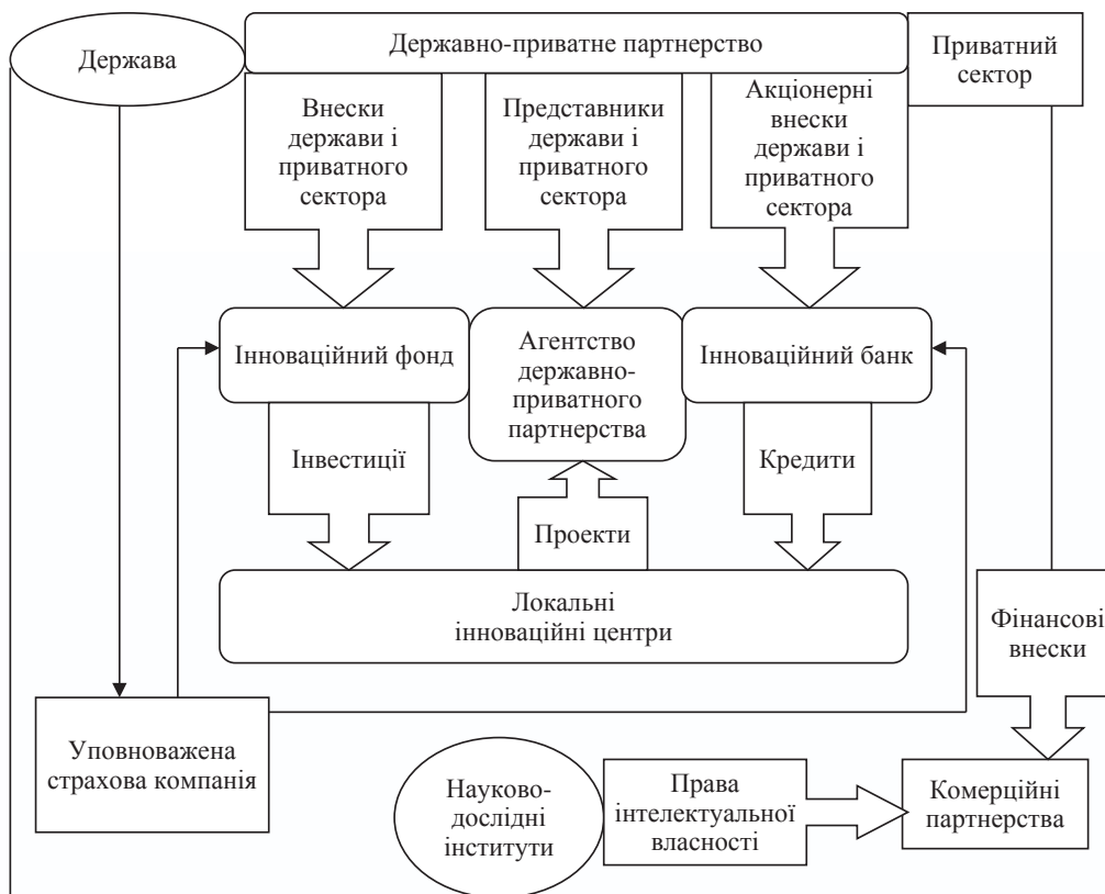
Рис. 1. Загальна схема взаємодії суб'єктів за «Програмою спільного фінансування розвитку локальних інноваційних центрів»

- надання прямих кредитів Інноваційним банком тим ЛПЦ, які з тих чи інших обставин не можуть скористатися звичайними каналами залучення кредитних ресурсів. Це відкриє