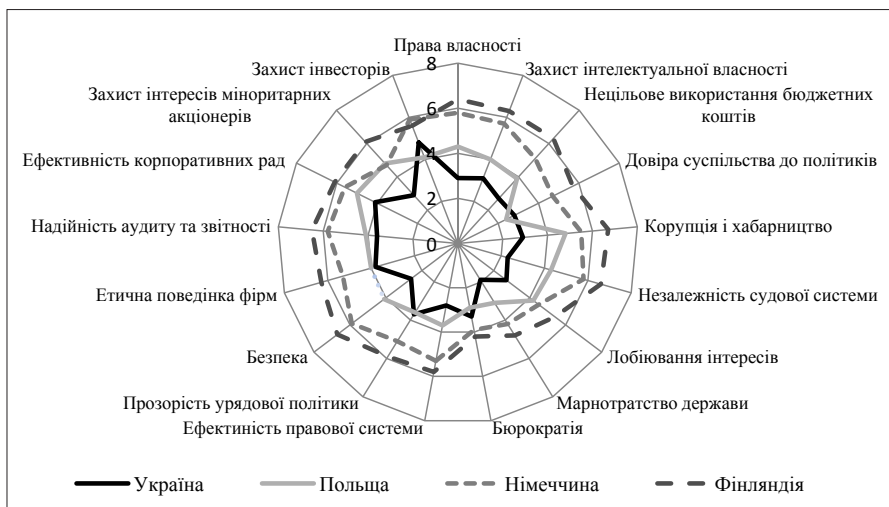
Рис. 2. Інституційні показники вибраних країн за 2016 р. [8]

Перевіримо наявність кореляційного зв'язку між рівнем суспільного добробуту та зведеним показником «якість інститутів». Для цього дослідимо динаміку суспільного добробуту на основі індексу А. Сена ( W_s , дол. США на особу) та динаміку показника «якість інститутів» за 2005–2016 рр., наведених у табл. 2.