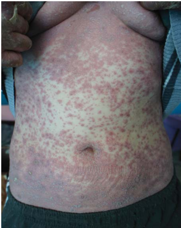
Рис. 1 Хвора С., 35 років. Загострення пустульозного псоріазу на фоні гіпокальціємії

Важливу роль перерахованих вище тригерних факторів підтверджують і наші власні спостереження за хворими на пустульозну форму псоріазу (рис. 1, 2).