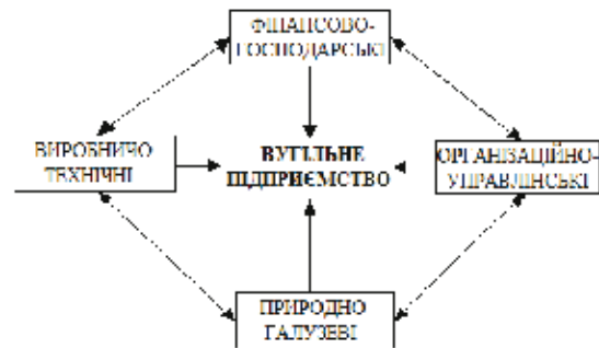
Рис.1. Фактори впливу внутрішнього середовища на вугільне підприємство

Природно-галузеві – фактори, сформовані й обумовлені природно-географічними умовами функціонування підприємства та специфікою галузі, її технологічними процесами (тяжіння до певного виду ресурсу, залежність від природно-кліматичних умов, капітало- та працемісткість, складність виробництва тощо). Саме природно-галузеві фактори є найбільш специфічними, і на них буде націлена основна увага в даній роботі. Місце природно-галузевих факторів у загальній системі факторів впливу внутрішнього середовища на вугільне підприємство графічно зображено на рис. 1.