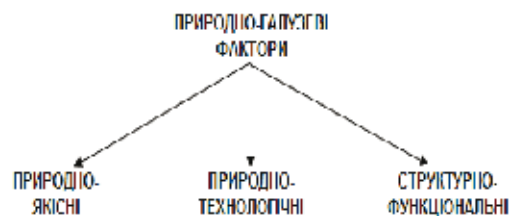
Рис. 2. Природно-галузеві фактори впливу внутрішнього середовища на вугільне підприємство

Природно-галузеві фактори – це такі фактори впливу внутрішнього середовища вугільного підприємства, що обумовлені специфікою вугільної галузі та природними характеристиками того родовища, яке розробляється, обумовлюють якісний склад продукції підприємства, характеризують зміни в галузі, напрями її розвитку та можливі перешкоди на цьому шляху. Основною класифікаційною ознакою природно-галузевих факторів внутрішнього середовища вугільного підприємства, на нашу думку, доцільно назвати можливість зміни ступеня впливу факторів цієї групи на процес стратегічного планування розвитку підприємства. Тому природно-галузеві фактори впливу внутрішнього середовища, у свою чергу, доцільно розділити на підгрупи, що показані на рис. 2.