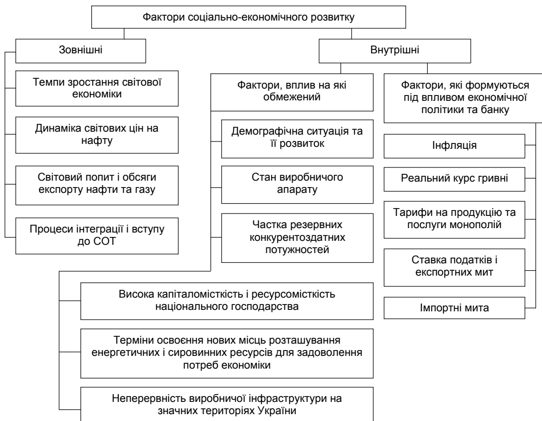
Рис. 1. Фактори, що впливають на сценарні умови соціально-економічного розвитку України

Сценарії на галузевому рівні розробляються, як правило, експертами Міністерства економіки України й мають прогнозний характер розвитку її економіки. Так, сценарії розвитку паливно-енергетичного комплексу базуються насамперед на факторах, що сформувалися в період кризи 1998 р. або безпосередньо після неї і пов'язані з ліквідацією ряду диспропорцій, що нагромадилися в докризовий період (рис. 1) [1].