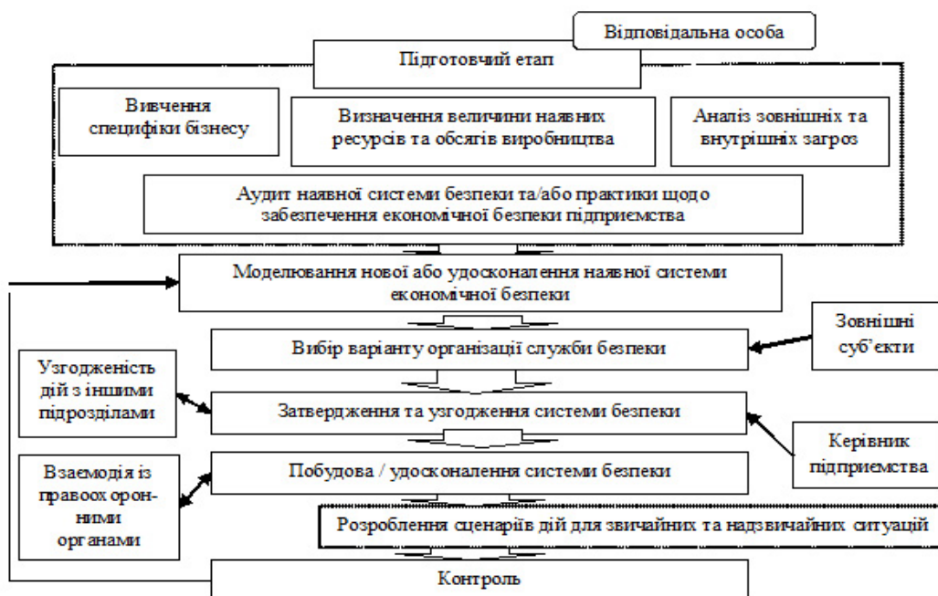
Рис. 2. Алгоритм формування системи економічної безпеки підприємства (власна розробка автора)

Створення надійної системи економічної безпеки підприємства передбачає необхідність проведення комплексу підготовчих заходів. Практика функціонування служби економічної безпеки суб'єктів підприємницької діяльності свідчить, що від результатів цього етапу багато в чому залежить рішення про вибір ва-