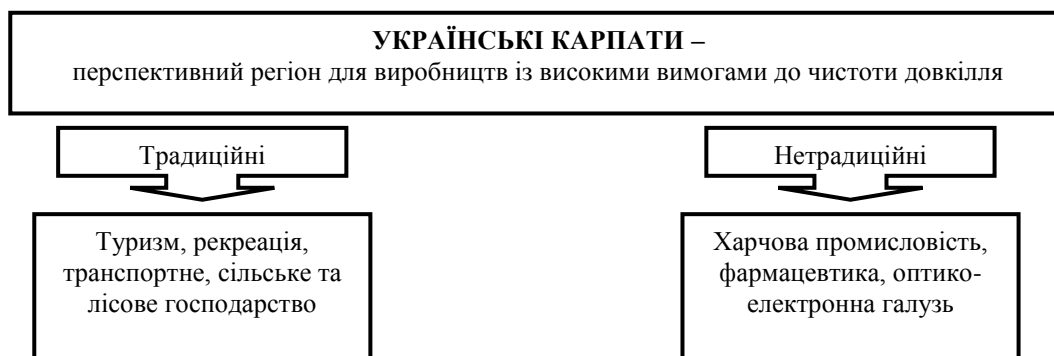
Рис. 1. Позиціонування Українських Карпат як перспективного регіону для виробництв із високими вимогами до чистоти довкілля

Розвиток нетрадиційних для гірських територій Українських Карпат виробництв повинен стати основою для виходу регіону з депресивного стану. Ці території слід представляти для потенційних внутрішніх і зовнішніх інвесторів як регіон, привабливий щодо розміщення виробництв із високими вимогами до чистоти довкілля (рис. 1).