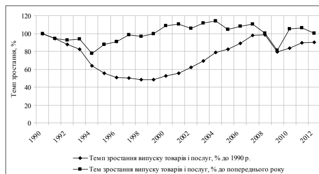
Рис. 1. Темпи зростання випуску товарів і послуг у 1990-2012 рр.

За час підйому економіки у 1995-2007 рр. система відчувала вплив чинників, які штучно сприяли зростанню випуску товарів і послуг. Ми маємо на увазі зменшення чисельності зайнятого населення. Якщо обсяг випуску товарів чи послуг упродовж 1990-2008 рр., з урахуванням усієї перипетії подій у цей період, дозволив майже відтворити урешті-решт рівень 1990 р., то кількість зайнятих в економіці зменшилася на 17,5% [6, с. 16; 9, с. 354]. Попереджаючи можливі заперечення, хотілося б виокремити деякі тенденції в динаміці цих двох макроекономічних показників, які не кореспондувалися і, унаслідок цього, повною мірою не дають підстав для об'єктивного тлумачення характеру змін в економічному зростанні (рецесії) у період 1990-2012 рр. (рис. 1). Зрозуміло, що процеси змін кількості зайнятих стосуються всього того, що розгорглося в Україні як складової світогосподарської системи загалом. Ми не принижуюмо їх значущість щодо впливів на зміни в суспільних перетвореннях, проте вони безпосередньо не кореспондувалися з управлінськими діями.