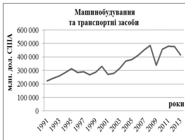
Рис. 1. Динаміка структури експорту Японії за основними секторами промисловості, млн. дол. США, 1980–2013 рр. [14]