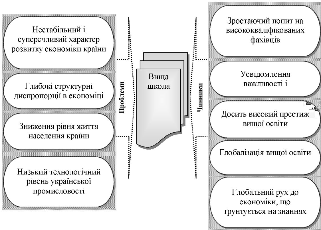
Рис. 1. Проблеми та чинники, що визначають можливість трансформації вищої школи

Зважаючи на чинники, які сприяють трансформації системи вищої освіти, необхідно враховувати той факт, що в даний час цей процес пов'язаний із цілим рядом проблем (рис. 1).