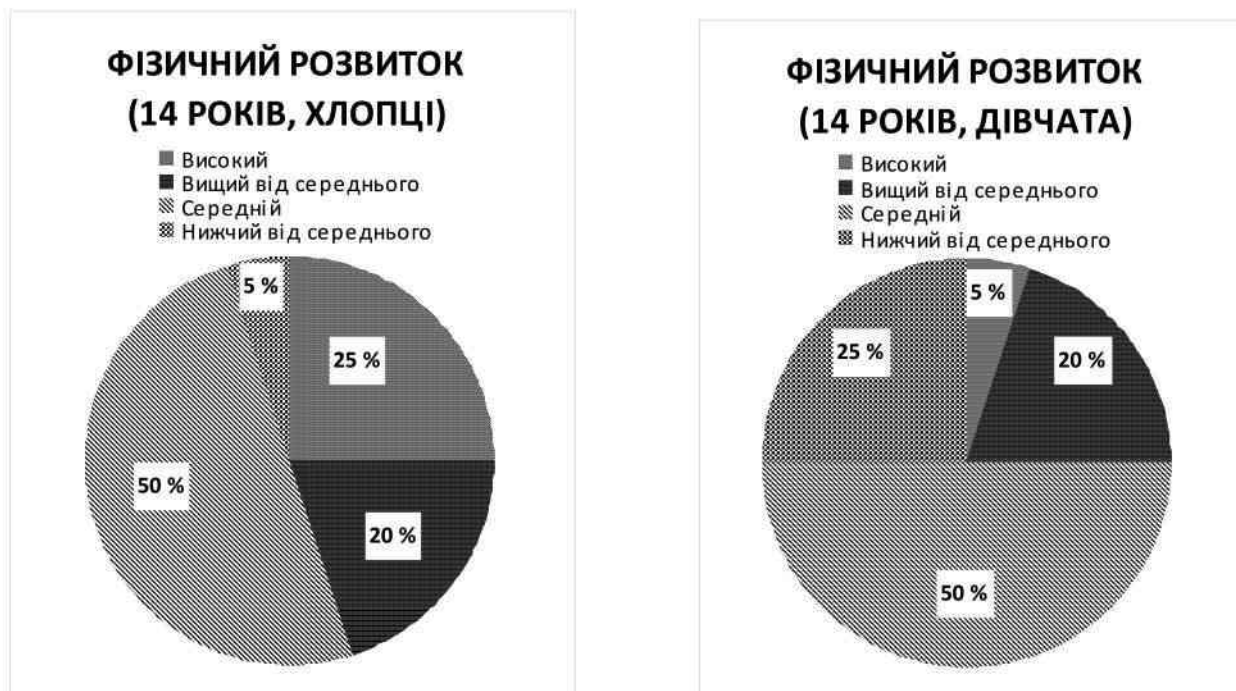
Рис. 6. Показники фізичного розвитку 14-річних дітей, що проживають в аграрній зоні

Таким чином, у підлітків за усередненими показниками рівень фізичного здоров'я відповідає середньому, незалежно від місця проживання, статі та віку обстежуваних. Цікаво, що низький рівень