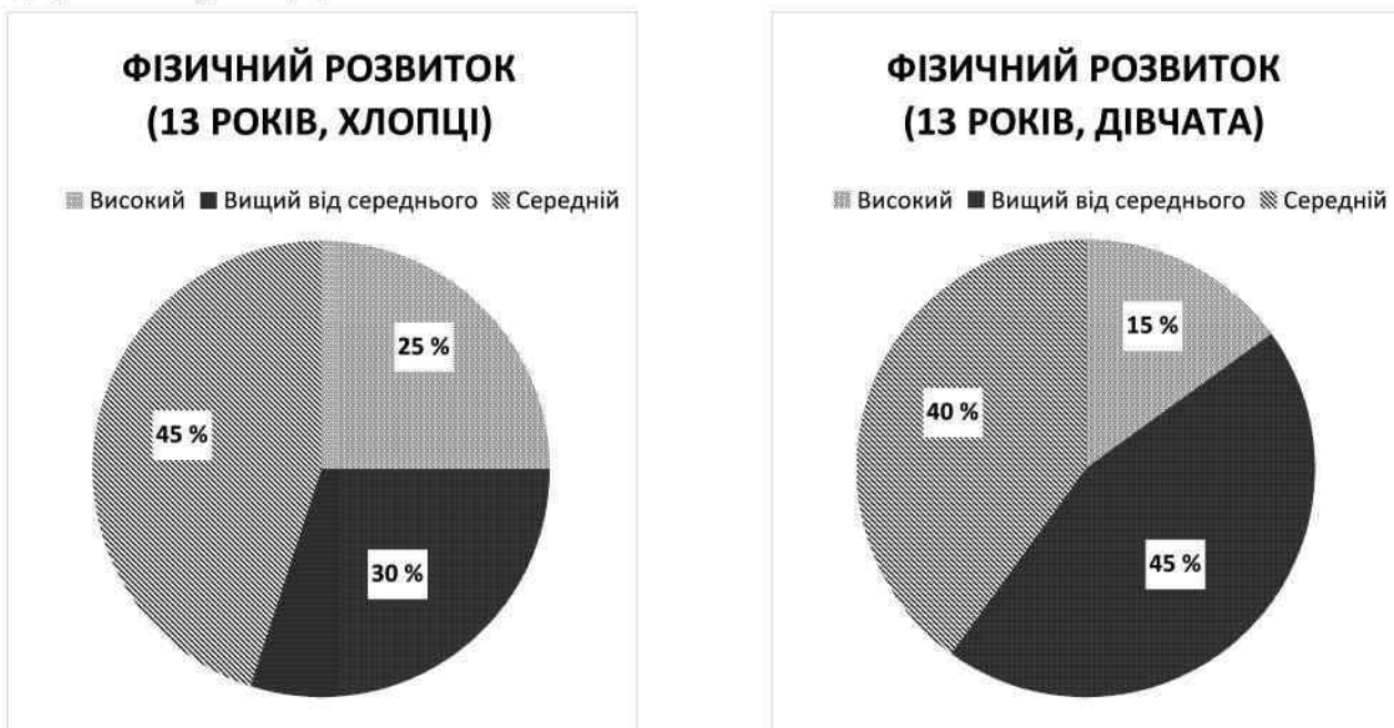
Рис. 3. Показники фізичного розвитку 13-річних дітей, що проживають в аграрній зоні

Серед 13-річних школярів аграрної зони не виявлено осіб із низьким фізичним розвитком, незалежно від статі. Найвищою часткою з низьким рівнем фізичного розвитку характеризувалися дівчата з міської зони, а осіб із фізичним розвитком, вищим від середнього, найбільше серед хлопців аграрної зони. Високий рівень фізичного розвитку теж більшою мірою зафіксовано у хлопчиків з аграрної зони (рис. 3; 4).