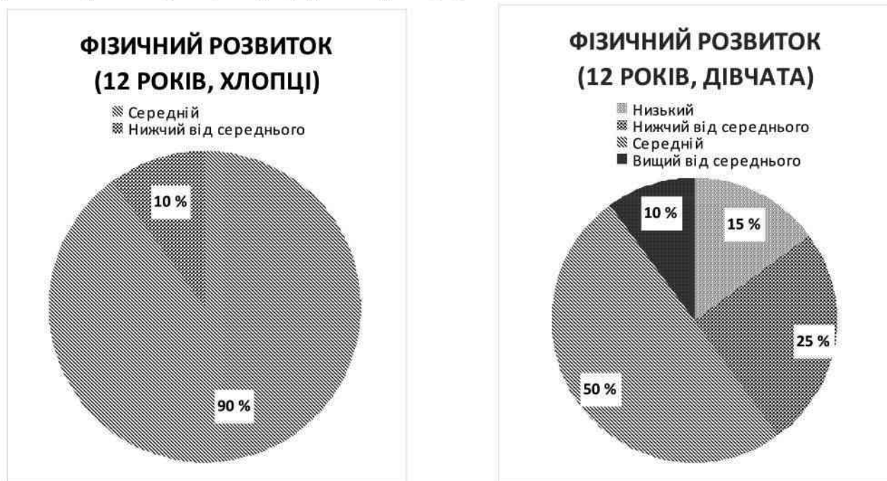
Рис. 1. Показники фізичного розвитку 12-річних дітей, що проживають у міській зоні

Враховуючи основні антропометричні показники підлітків, ми виявили такі особливості фізичного здоров'я школярів підліткового віку. Серед 12-річних хлопців, що проживають у місті, осіб із вищим рівнем фізичного розвитку не виявлено. Тоді як серед дівчат у 10 % осіб зафіксовано фізичний розвиток, вищий від середнього (рис. 1; 2).