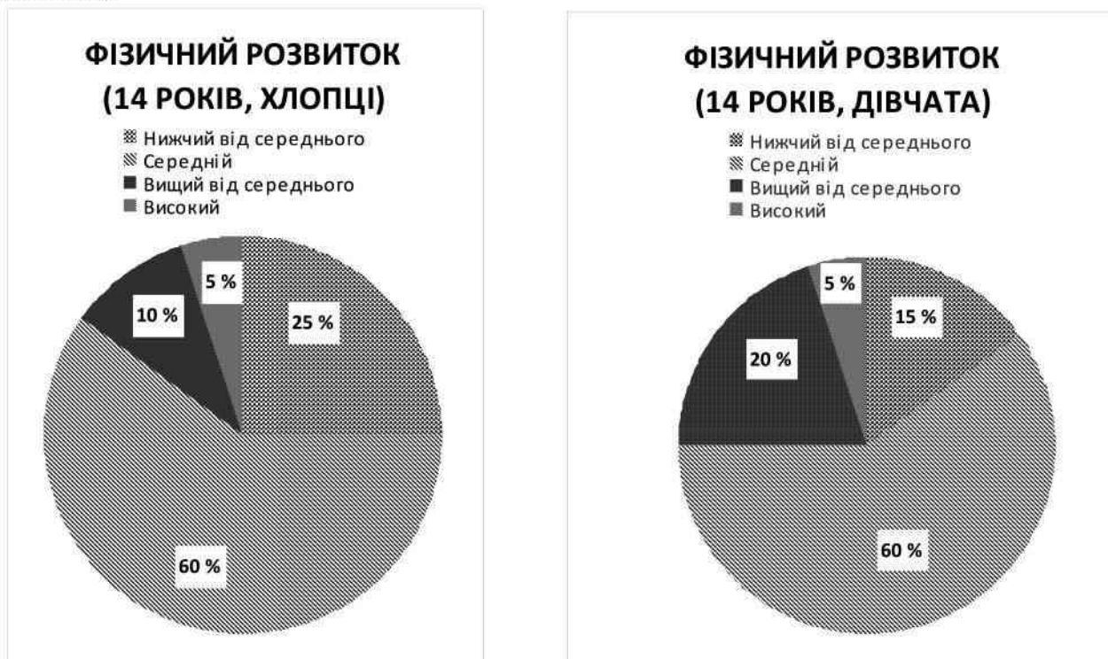
Рис. 5. Показники фізичного розвитку 14-річних дітей, що проживають у міській зоні

Серед школярів 14-річного віку вищий від середнього фізичний розвиток зафіксовано у 10 % хлопців міської зони та 20 % дівчат аграрної зони. Загалом у дівчат цього віку знижений фізичний розвиток, а саме низький та нижчий від середнього рівень більшою мірою проявлявся в аграрній зоні (рис. 5; 6).