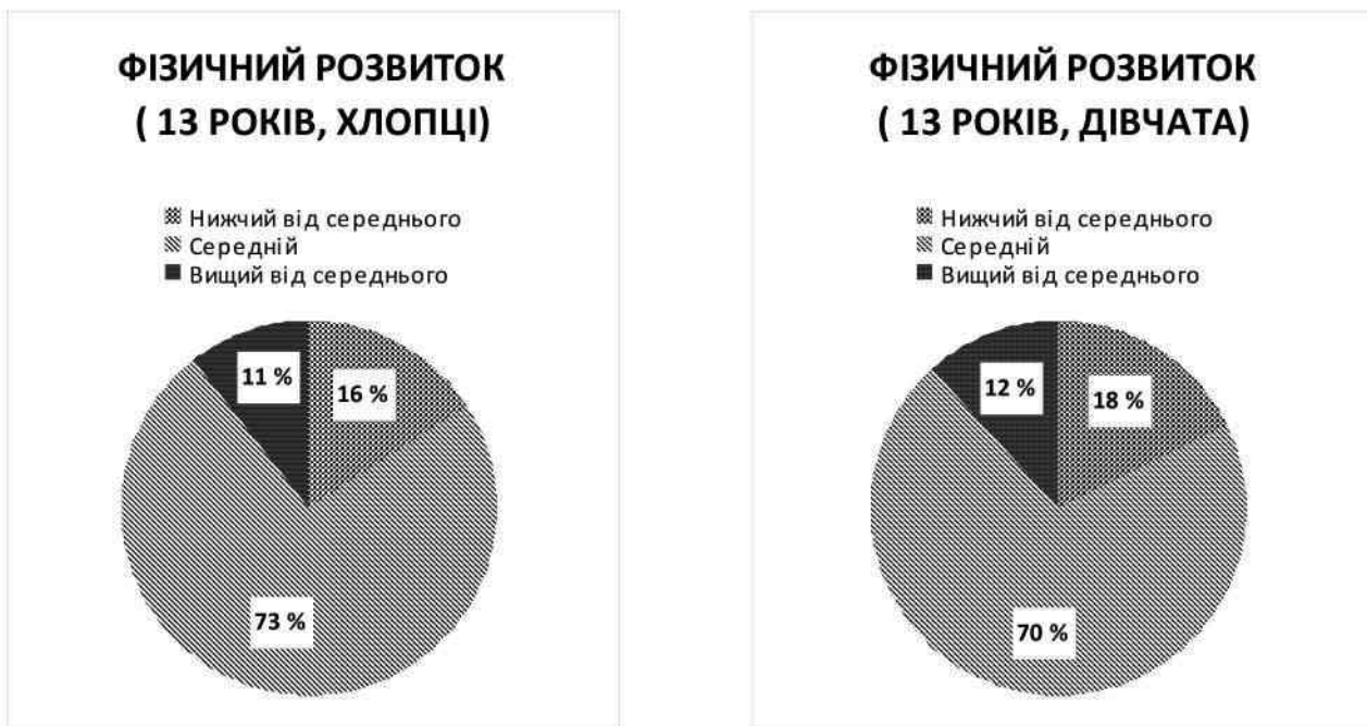
Рис. 4. Показники фізичного розвитку 13-річних дітей, що проживають у міській зоні