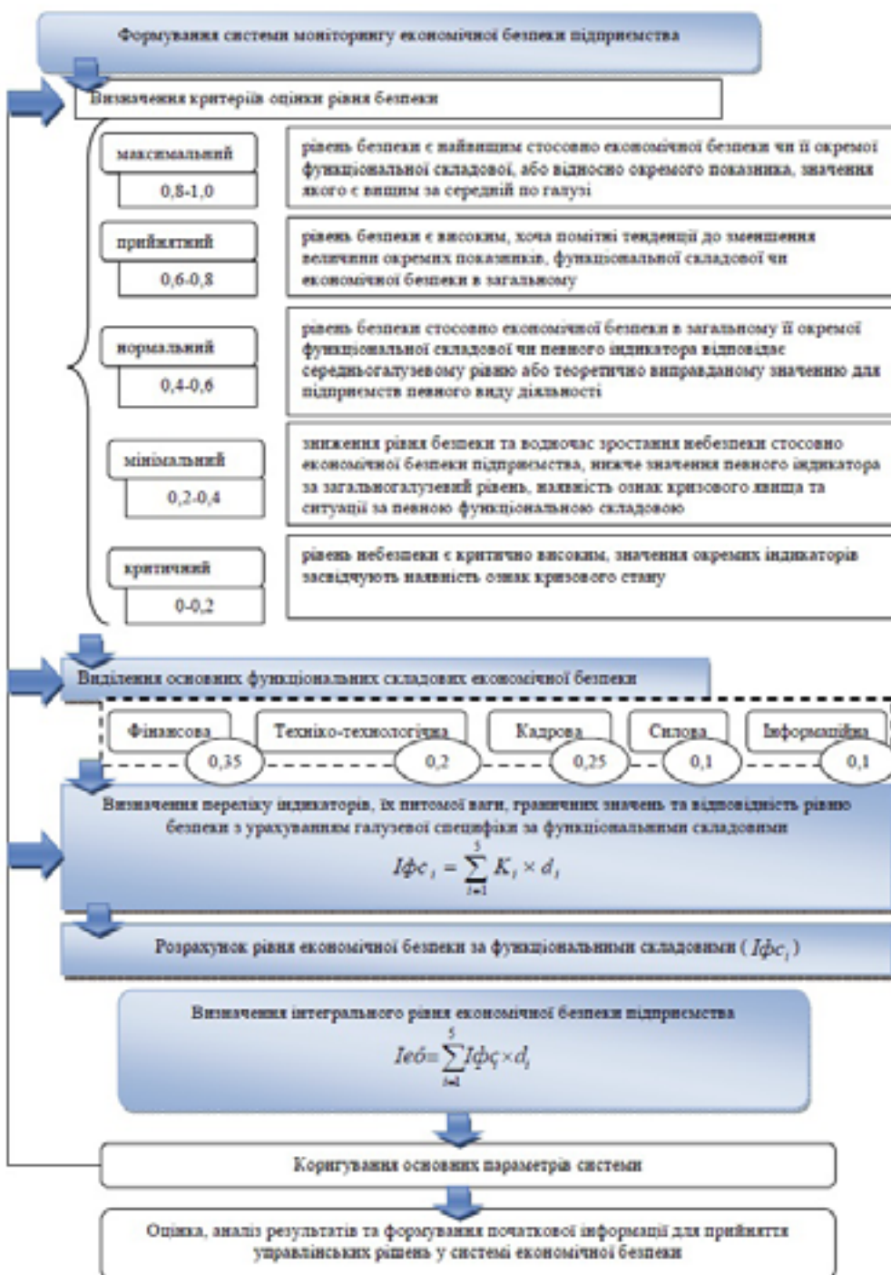
Рис. 2. Алгоритм формування системи моніторингу економічної безпеки підприємства

кожен рівень відрізняється від іншого передусім співвідношенням взаємопов'язаних понять «безпека – небезпека».