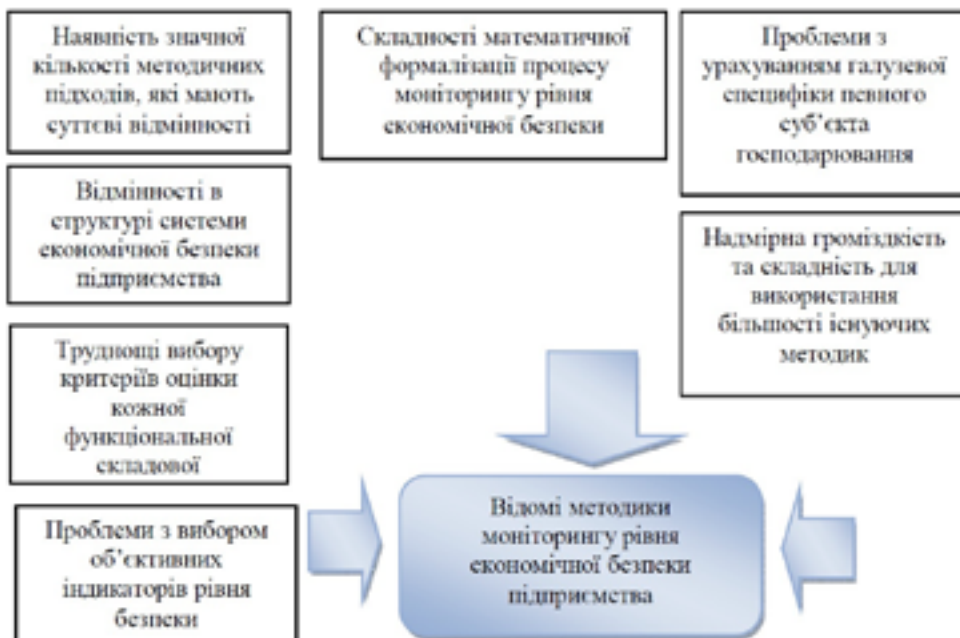
Рис. 1. Сукупність труднощів для активного застосування існуючих методик моніторингу рівня економічної безпеки

фінансових аспектів діяльності, а й інших основних функціональних складових економічної безпеки.