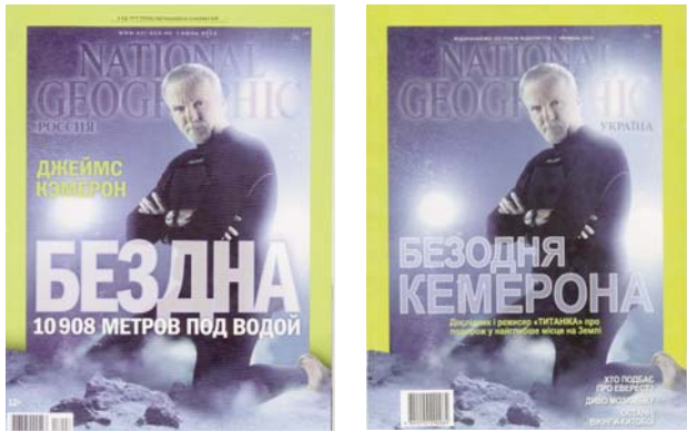
Рисунок 2. Обкладинки «National Geographic Россия» та «National Geographic Україна» (червень 2013 р.)