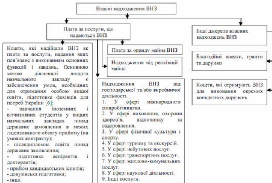
Рис. 2. Структура власних надходжень ВНЗ

На основі зведеного показника доходів кошторису визначається обсяг видатків спеціального