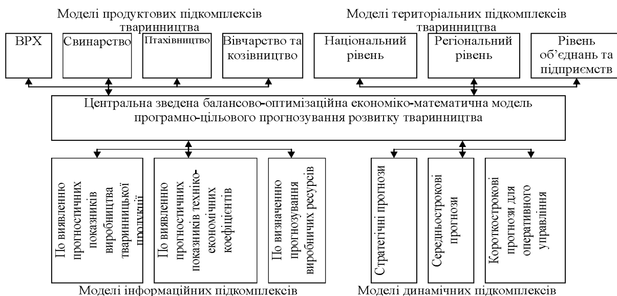
Рис. 3. Системи економіко-математичних моделей програмно-цілевого прогнозування розвитку тваринництва

У свою чергу, система економіко-математичних моделей програмно-цілевого прогнозування розвитку (СЕММ ПЦПР) виробництва продукції тваринництва, представлена на рис. 3, складається з чотирьох комплексів забезпечуючих моделей (продуктових, інформаційних, регіональних, динамічних) і центральної ЕММ програмно-цілевого прогнозування розвитку виробництва.