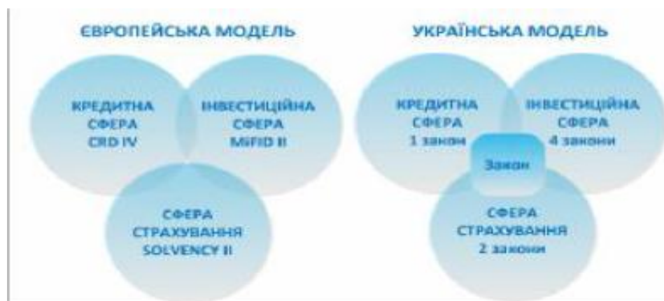
Рис. 1. Порівняння європейської та української моделей документування процесів регулювання ринків фінансових послуг

Існує також відмінність між моделями документування процесів регулювання фінансових послуг за видами, проілюстрована на Рис. 1.