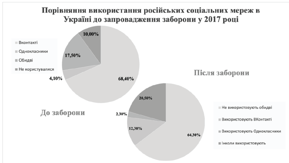
Рис. 2. Порівняння використання російських соціальних мереж в Україні до запровадження заборони у 2017 році

Водночас 53,8 % опитаних позитивно ставляться до заборони російських соціальних мереж, 33,9 % – нейтрально, 10,5 % – негативно, 1,8 % респондентів нічого не знають про заборону.