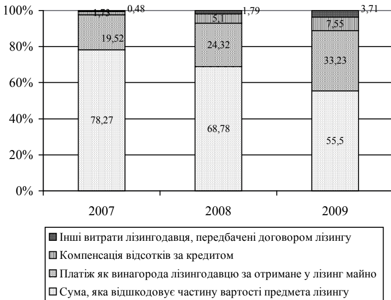
Рис. 2. Структура лізингових платежів у 2007-2009 рр., %*

Протягом останніх трьох років значної якісної зміни зазнала і структура лізингового платежу (рис. 2).