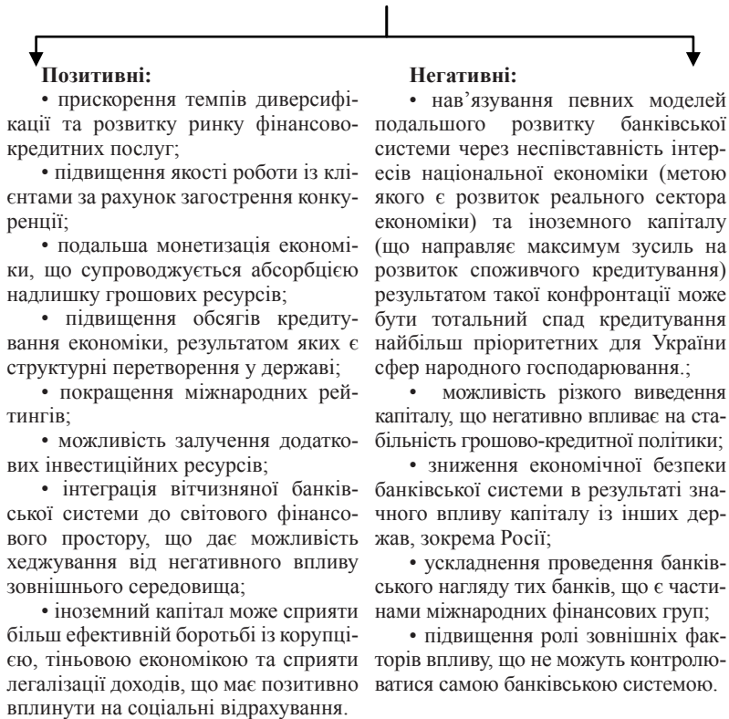
Рис. 2. Основні прояви впливу іноземного капіталу на фінансову стійкість банківської системи України [4, с. 32; 5, с. 245]

Таким чином, вплив іноземного капіталу на фінансову стійкість банківських систем значний, а тому підвищення його ролі в економіці має повною мірою відповідати економічним інтересам країни та узгоджуватися із станом як внутрішньодержавного економічного середовища, так і світовим фінансово-економічним реаліям.