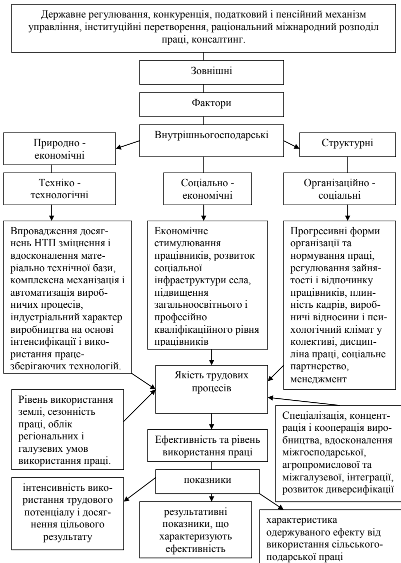
Рис. 1. Система чинників і показників продуктивності праці з показниками ефективності в підприємствах у сільському господарстві