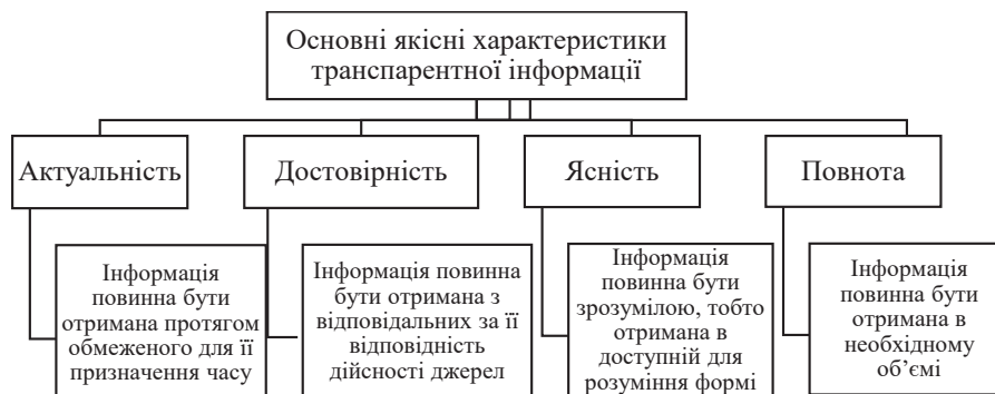
Рис. 2. Основні якісні характеристики прозорої інформації підприємства

Основні якісні характеристики прозорої інформації підприємства наведено на рис. 2. До них відносять актуальність, достовірність, ясність та повноту.