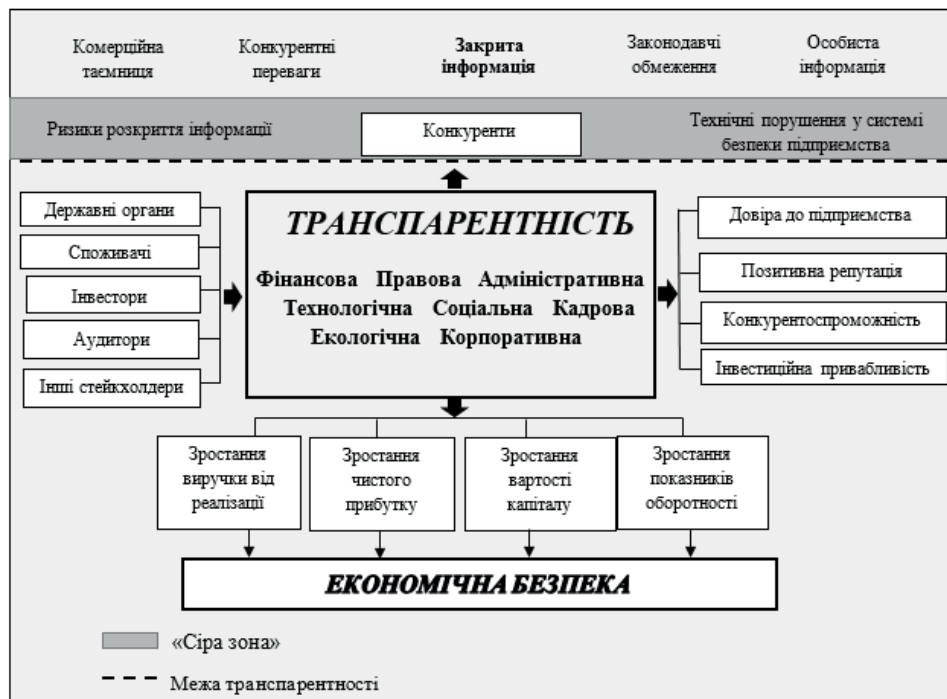
Рис. 4. Вплив транспарентності на діяльність підприємства на основі безпекоорієнтованого підходу

Відповідно до вищевказаного дослідження переваг та недоліків транспарентності варто зазначити, що транспарентність повинна мати встановлені межі. Ці межі повинні перш за все визначати об'єм інформації, яка є необхідною для підвищення репутації підприємства та водночас яка задовольнила б інтереси всіх зацікавлених учасників та не несла б загрози економічній безпеці підприємства. Крім того, між такими межами транспарентності існує так звана «сіра зона», у якій існують ризики розкриття інформації для конкурентів, наприклад, шляхом комерційного шпionажу або недоліків системи безпеки підприємства (рис. 4.).